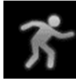
Ai모션 (사람 감지)